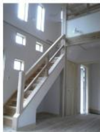
無垢の木の香り漂う空間です。