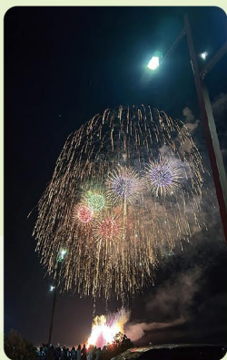
今回のBGMは「地上の星/中島みゆき」でお楽しみください。